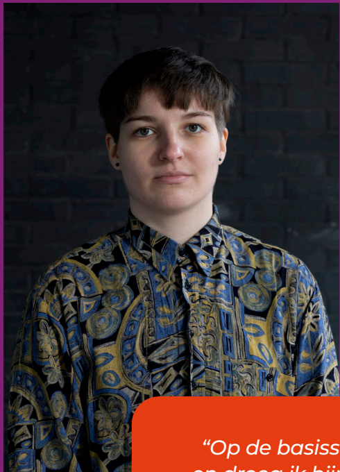
Zingha (20), hen/hun – die/diens

Niet alleen de manier waarop docenten en leerlingen met elkaar omgaan maakt een school genderinclusief; ook met bepaalde praktische zaken geef je als school ruimte aan genderdiversiteit.