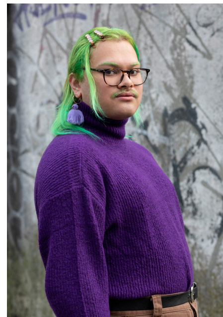
Mando (21), hen/hun – zij/haar

Bron: H. Felten (2017) Genderhokjes doorbreken: (hoe) werkt dat? De resultaten van een theorie-gestuurde evaluatie. Genderdiversiteitalliantie