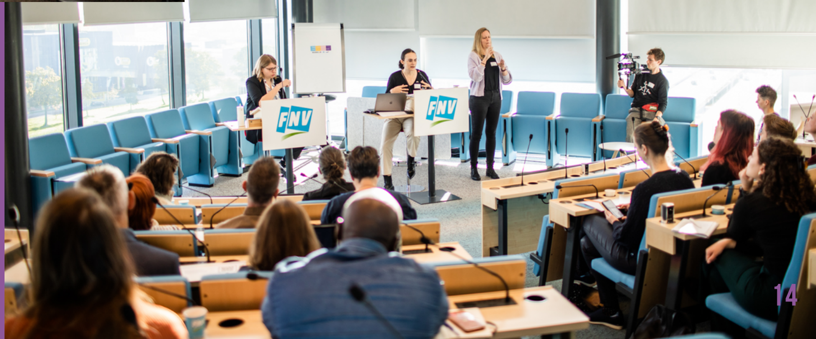
Inclusion4all conferentie van Transgender Netwerk en FNV