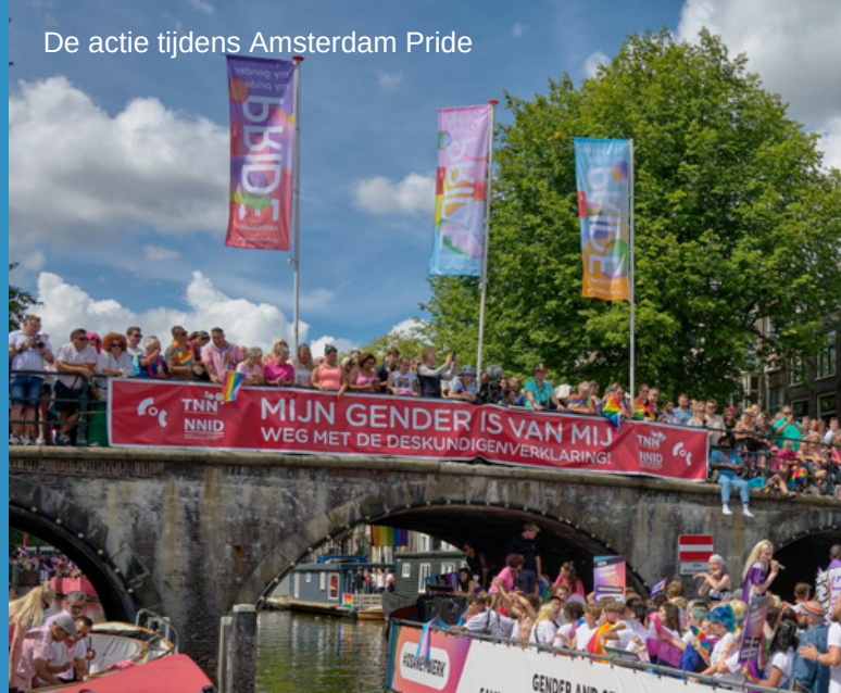
De actie tijdens Amsterdam Pride

In 2022 stond de vereenvoudiging van de zogenoemde Transgenderwet centraal. Hiernaast vroegen we onder andere aandacht voor het door de overheid betaalde transitieverlof, de voortgang van strafbaarheid van groepsbelediging, het verbeteren van de transgenderzorg en de aanpak van veiligheid van transgender personen.