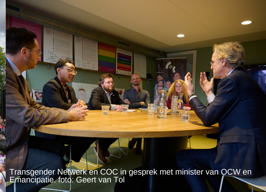
Transgender Netwerk en COC in gesprek met minister van OCW en Emancipatie.