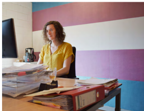
GIDS VOOR WERKGEVERS, DIVERSITEITSADVISEURS, HR- EN PERSONEELMANAGERS

Dordrecht hebben ondertekend, heeft TNN op Coming-Out dag een gids voor werkgevers, diversiteitsadviseurs, HR en personeelsmanagers gepubliceerd. Deze gids is aanvullend op de voorlichtingsbrochure Transgender en werk bedoeld. Op basis van wetenschappelijke inzichten laat het zien wanneer diversiteit- en inclusiebeleid ook werkt voor transgender personen, en onder welke voorwaarden. Kort gezegd, wanneer werkt wat. De gids bevat verder inspirerende en concrete voorbeelden. De gids is verzonden aan alle regenbooggemeentes en aan alle werkgevers in ons netwerk. De gids zelf is grotendeels overgenomen door mediaplatform one world.