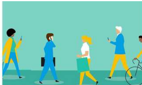
Toolkit onnodige seksregistratie voor nationale overheid