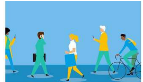
Toolkit onnodige seksregistratie voor bedrijven